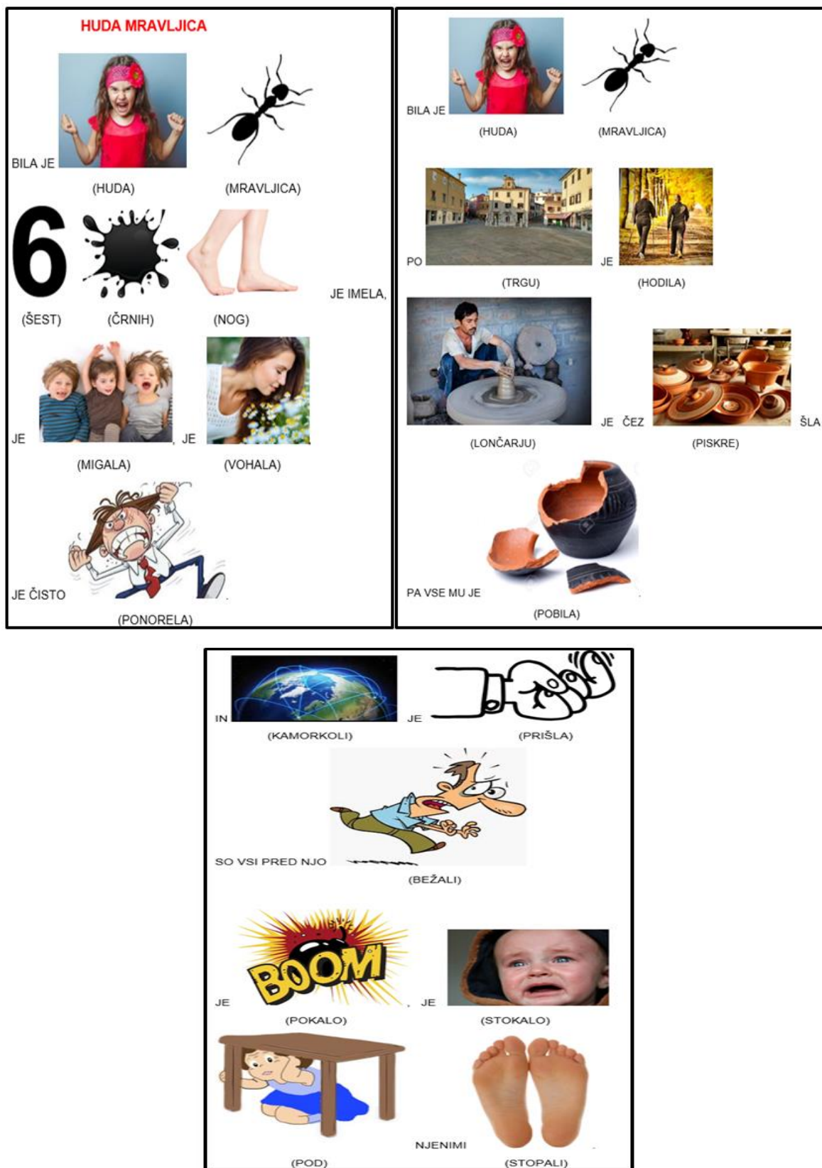
Slika 2: Slikopis odlomka pesmi Branka Rudolfa z naslovom Huda mravljica