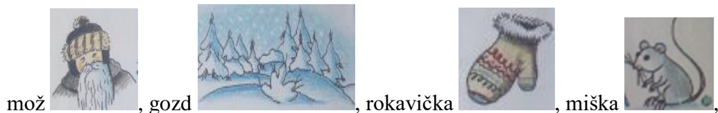
mož , gozd , rokavička , miška ,