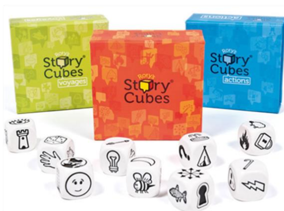
Slika 3: Roryeve pripovedne kocke - osnovni komplet

Osnovni komplet vsebuje devet kock, ki pa ga lahko kasneje razširimo z različnimi dopolnilnimi kompleti. Na ploskvah kock so narisane različne slike, s pomočjo katerih pripoveduješ zgodbo. Kocke naj bi spodbujale kreativno razmišljanje in povečevale sposobnost reševanja problemov, olajšale naj bi socializacijo ter pospešile razvoj uporabe jezika ter posledično povečevale besedni zaklad (PRO-ANDY, 2020).