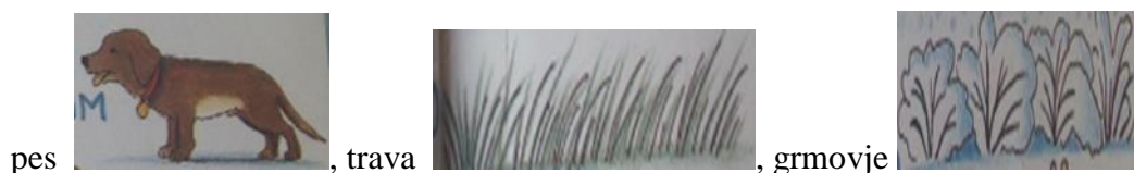
pes , trava , grmovje ,