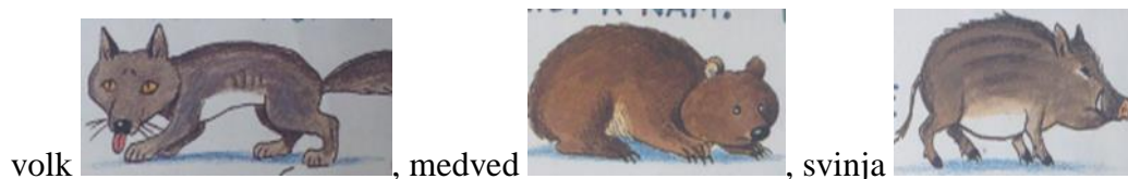
volk , medved , svinja ,