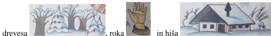
drevesa , roka , in hiša .

V zgodbi najdemo tudi nesmisel pri sami vsebini in posledično kasnejši upodobitvi samostalnika. Na le-tega naletimo pri dogodku, ko se živali prestrašijo in zbežijo iz rokavičke ter se poskrijejo in je eno od teh skrivališč trava, ki je med zimo, ko je pokrajina pobeljena s snegom, ne moremo videti.